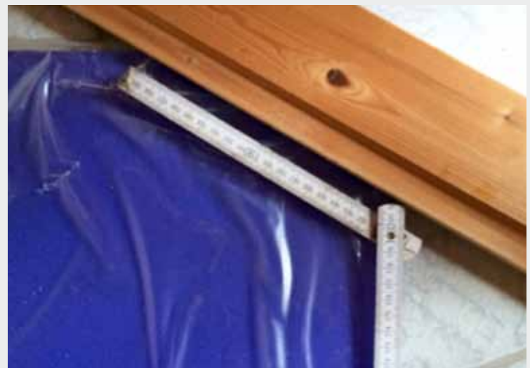
Abb.6: Abschrägungen können prima mit einem Zollstock gemessen werden.

BIS ZU 10 Jahre Garantie AUF DRUCK & PLATTE