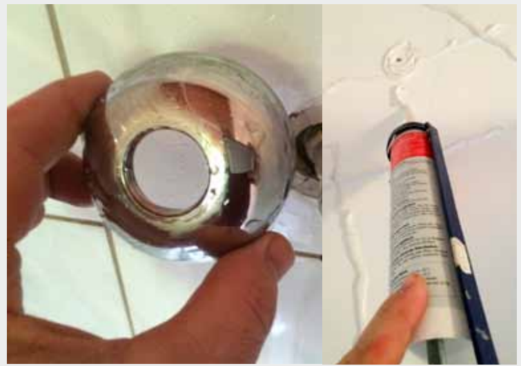
Abb.4: Blenden abmontieren und Rückwand mit Montagekleber versehen.