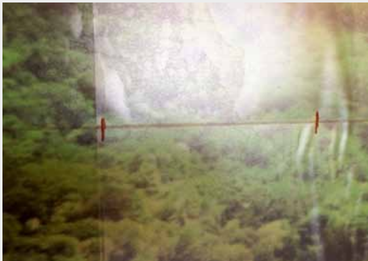
Abb.2: ...und auf Duschrückwand einzeichnen.