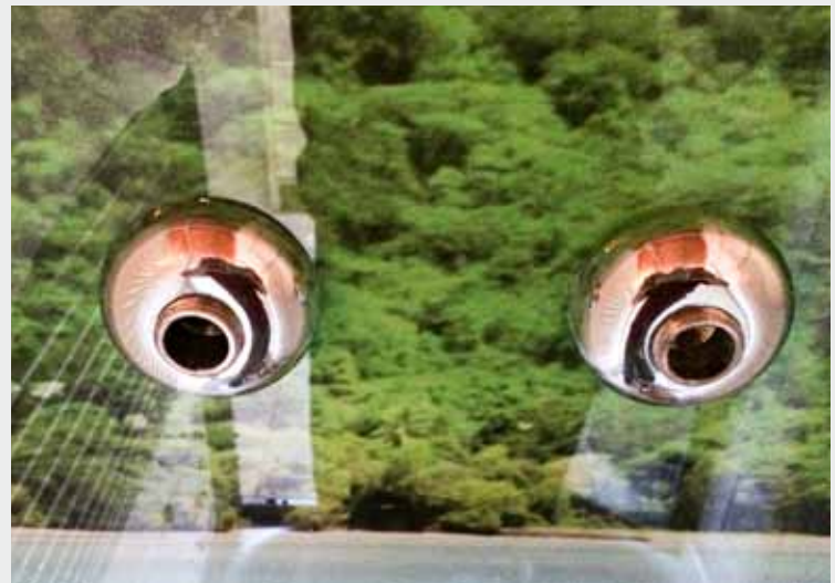
Abb.5: Nach Anbringen und Ausrichtung der Rückwand kann die Verblendungen der Armaturen wieder montiert werden.