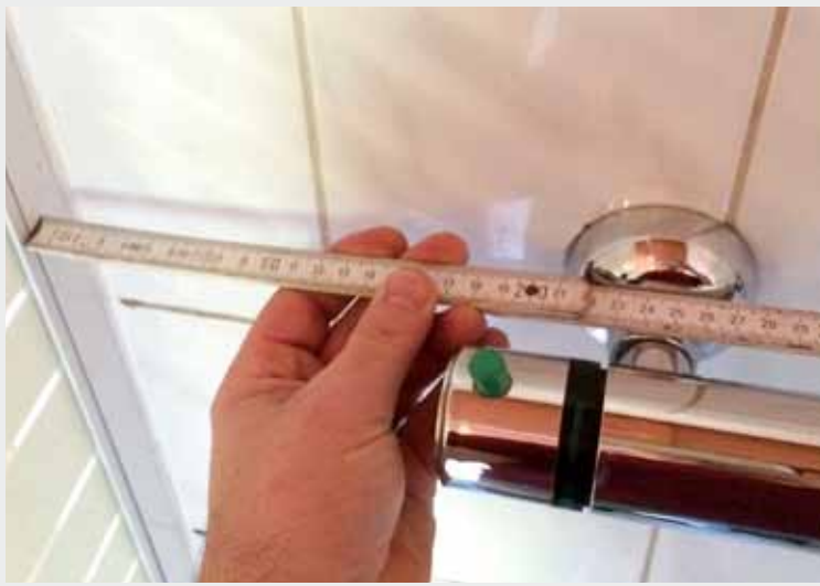
Abb.1: Abstände der Armaturen messen ....