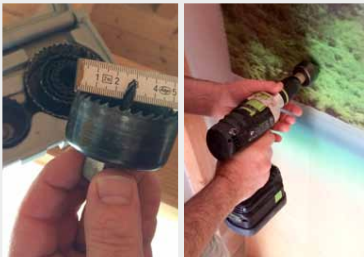
Abb.3: Richtigen Lochkronenbohrer wählen und Löcher bohren